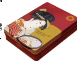
第1弾デザイン 「歌麿の美人画」