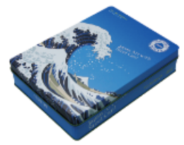
第2弾デザイン 「世界遺産の富士山」